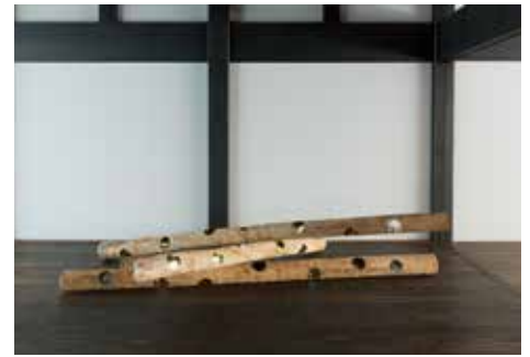
「越後正志 抜け穴」(2017)の様子 アーティスト：越後正志 / キュレーター：鷲田めろろ