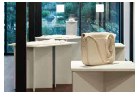
「山本優美 間-あわい-を読む」(2018)の様子 アーティスト：山本優美 / キュレーター：尺戸智佳子